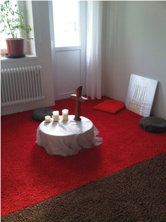
Auf ein Wiedersehen im Gemeinschaftenhaus Nürnberg!

Der Andachtsraum im 1. Stock wird schon jetzt rege genutzt.