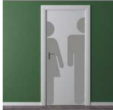
Tür-Tattoos ALDI Fotoservice Wanddesign WC Keller