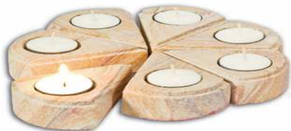
Tücher, Kerzen, Muggelsteine, Ölkreiden Treppenhaus Fenster