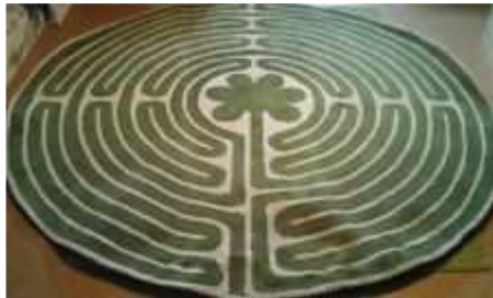
runde Teppiche oder rechteckig Gemeinschaftsraum