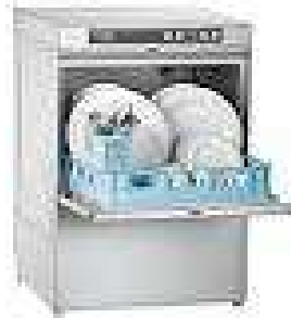
ECO 502-10 Gemeinschaftsküche 1.600.- €