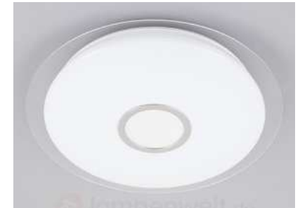
4 Stück, Luzia, LED, dimmbar, Ø 60cm Gemeinschaftsraum