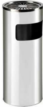
25x60 cm Gemeinschaftsraum Lichtschacht 70.- €