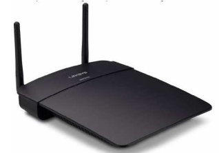
Linksys WAP300N Access Point oder Cisco AIRONET 1600 SERIES High-End-Access-Point 77.-€ WG Flure, 2 Stück pro WG!