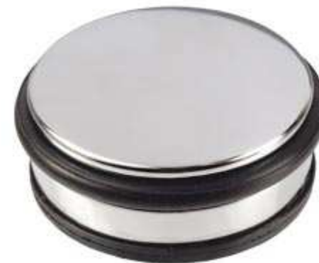
Türstopper und einen für die Decke (Gummi) Gemeinschaftsraum